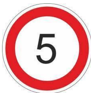
Рисунок 6. Знак «Ограничение максимальной скорости» (3 штуки с крепежом на 1 стойку)

№ 2.5 с размером 700 мм, тип: II, тип пленки А, крепление под одну стойку.