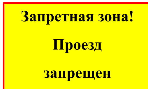
Рисунок 2. Знак «Запретная зона! Проезд запрещен» (15 штук) размер 40 см х 60 см, с надпись черного цвета на желтом фоне и красная окантовка шириной 1 см., способ крепление (4 отверстия диаметром 6мм. по углам знака).

Рисунок 1. Знак «Запретная зона! Проход запрещен» (100 штук) размер 40 см х 60 см, с надпись черного цвета на желтом фоне и красная окантовка шириной 1 см., способ крепление (4 отверстия диаметром 6мм. по углам знака).