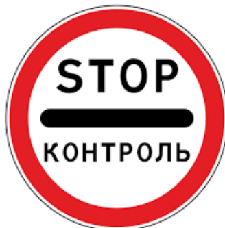
Рисунок 4. Знак «Контроль» (3 штуки с крепежом на 1 стойку)

№ 3.24 с размером D=700 мм, тип: II, тип пленки А, крепление под одну стойку.