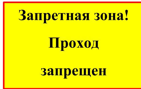
Рисунок 1. Знак «Запретная зона! Проход запрещен» (100 штук) размер 40 см х 60 см, с надпись черного цвета на желтом фоне и красная окантовка шириной 1 см., способ крепление (4 отверстия диаметром 6мм. по углам знака).